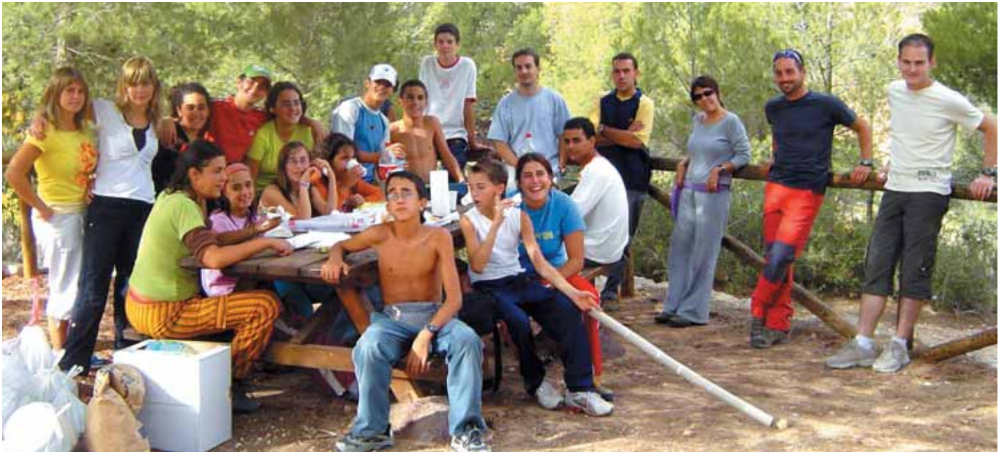
ELS PARTICIPANTS I MEMBRES DEL "CLUB DE MUNTANYISME" DEL PINÓS