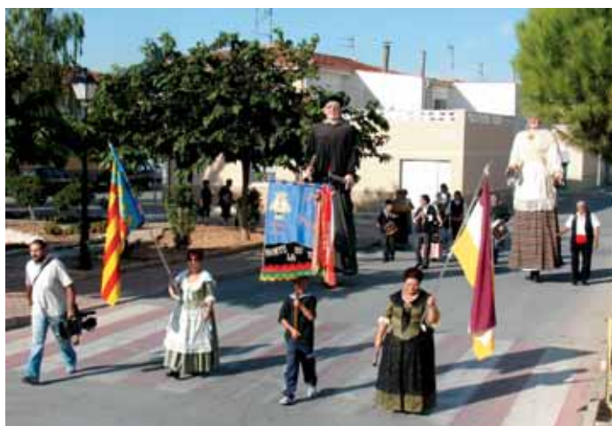
PASACALLES CON EL QUE SE INICIARON LOS ACTOS