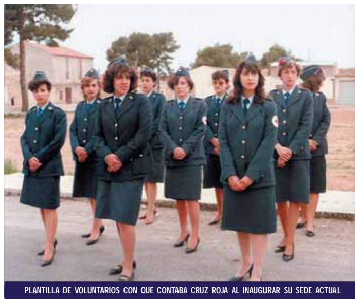
PLANTILLA DE VOLUNTARIOS CON QUE CONTABA CRUZ ROJA AL INAUGURAR SU SEDE ACTUAL

El nuevo local comienza su andadura con muebles cedidos gratuitamente por empresas locales y aportaciones