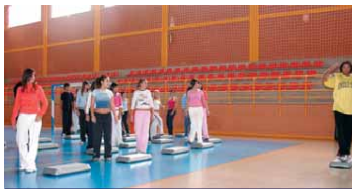
GRUPO DE ALUMNOS, SIGUIENDO LAS INDICACIONES DEL MONITOR DE AERÓBIC

Este es el segundo año que se imparte el Desayuno Saludable en los colegios de primaria de la localidad. La Concejalía de Consumo, consciente de la importancia que tiene la alimentación en la población escolar, declinó la realización de estos talleres a miembros de la empresa COVISAL, Consultores en Seguridad Alimentaria.