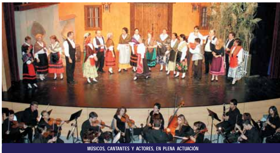
MÚSICOS, CANTANTES Y ACTORES, EN PLENA ACTUACIÓN

Las clases se impartirán desde el mes de noviembre, todos los viernes, de 5.30 a 7.30 de la tarde, hasta el mes de junio de 2007. Al igual que el pasado año, al finalizar el periodo de aprendizaje se llevará a cabo una representación teatral, para que los alumnos muestren a familiares y público en general las nociones de teatro que han aprendido a lo largo de varios meses.