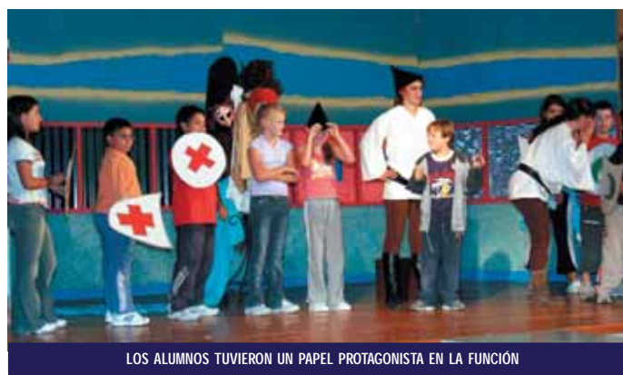
LOS ALUMNOS TUVIERON UN PAPEL PROTAGONISTA EN LA FUNCIÓN

Los alumnos de los dos colegios del municipio, “San Antón” y “Santa Catalina”, cambiaron por unas horas las aulas de sus centros por el escenario de la Casa de Cultura. El motivo no fue otro que participar en la campaña anual “Vamos al Teatro”, que tiene como fin iniciar a los alumnos en el mundo del teatro y el desarrollar su imaginación. Aunque en esta ocasión también sirvió para introducirlos en la literatura valenciana, puesto que la representación del 17 de octubre estuvo basada en la obra de Joan Martorell “Tirant lo Blanc”.