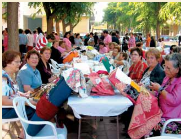
PARTICIPANTES EN EL ENCUENTRO DE ZENETA (MURCIA)

Hasta el municipio de Monzón, en Huesca, se desplazó un grupo de pinoseros, en representación de la Asociación “Boixet”, Taller de Bolillos de Pinoso, para participar en la primera edición de una de las ferias de artes y oficios tradicionales con más auge de la provincia de Huesca, por una invitación del propio Ayuntamiento de Monzón.