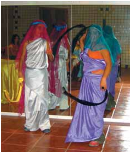
MOMENT DE LA REPRESENTACIÓ TEATRAL AMB MOTIU DEL 9 D'OCTUBRE

Volem agrair la col·laboració del l'Ajuntament del Pinós, concretament a l'àrea de Medi Ambient, també de tots aquells pares que van participar, i molt especialment agrair al "Club de Muntanyisme del Pinós" i companyia, per la seua col·laboració desinteressada. Gràcies a tots/tes.