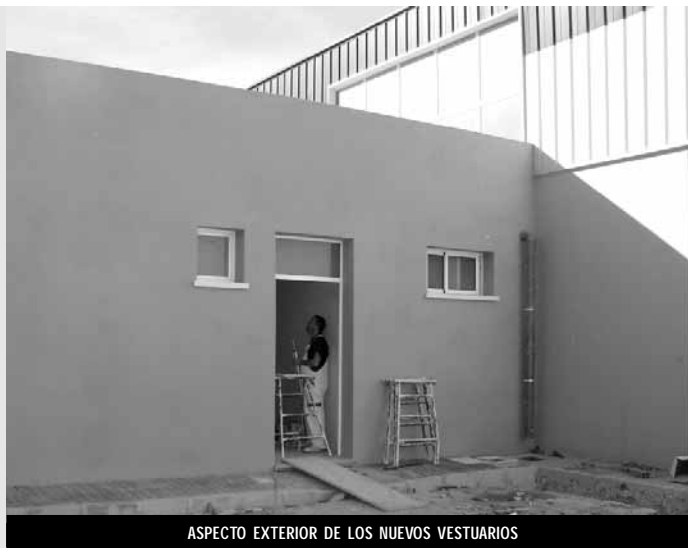
ASPECTO EXTERIOR DE LOS NUEVOS VESTUARIOS

La obra, que ha recibido una ayuda del 50% por parte de la Diputación Provincial de Alicante, tiene un presupuesto que supera los 117.000 euros, y la empresa que se encarga de realizar la obra está siendo "Omega Urbacivil S.L."