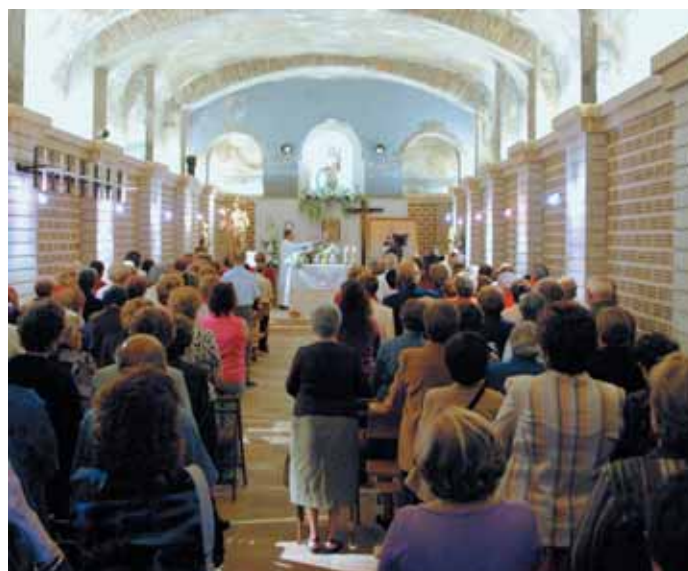
ASPECTO QUE PRESENTABA LA ERMITA EN LA MISA DEL 7 DE OCTUBRE

La ermita de Santa Catalina acogió, este año, y por circunstancias de rehabilitación del templo parroquial, las celebraciones en honor a la Virgen del Remedio, una festividad que se viene realizando desde el año 1851, en que se constituye oficialmente su patronazgo en la localidad.