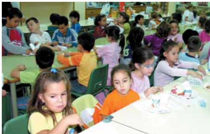
ALUMNOS DEL COLEGIO SANTA CATALINA, ACABANDO DE DESAYUNAR