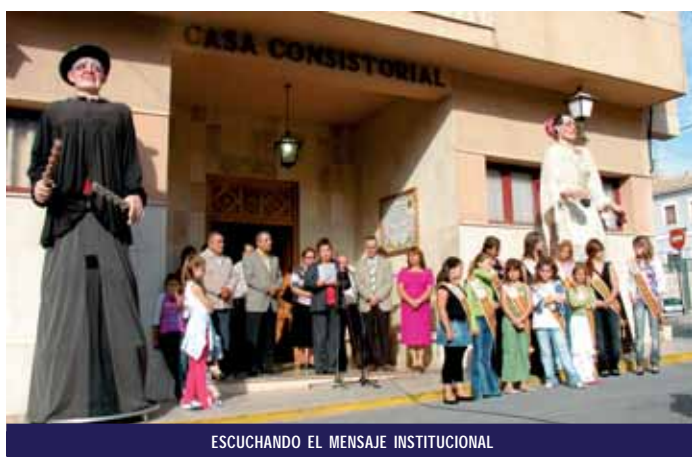
ESCUCHANDO EL MENSAJE INSTITUCIONAL

Danses populars, missatge institucional i esmorzar popular. Aquestos van ser els actes que, des del Consistori pinoser, es van preparar per celebrar el Nou d'Octubre.