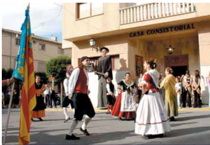
TRAS LOS PARLAMENTOS, EL GRUPO "MONTE DE LA SAL" INTERPRETÓ LAS DANZAS TRADICIONALES

D'aquesta manera, el poble del Pinós se va sumar als actes institucionals que, amb motiu del Dia de la Comunitat Valenciana, van fer molts pobles de la nostra comunitat.