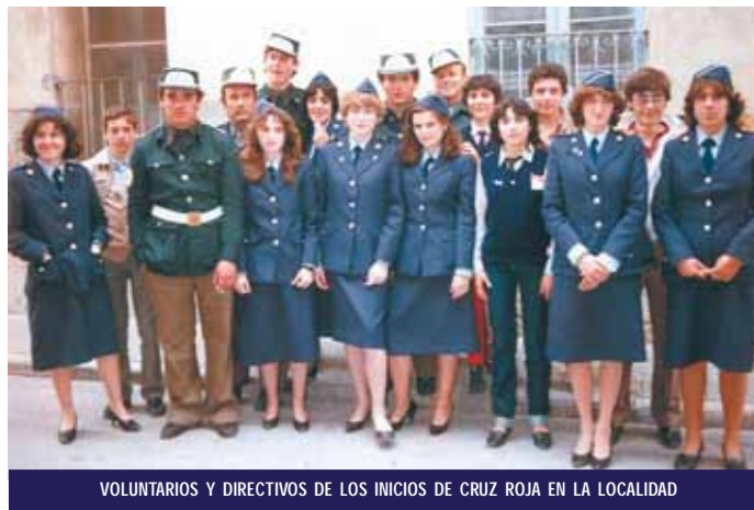
VOLUNTARIOS Y DIRECTIVOS DE LOS INICIOS DE CRUZ ROJA EN LA LOCALIDAD