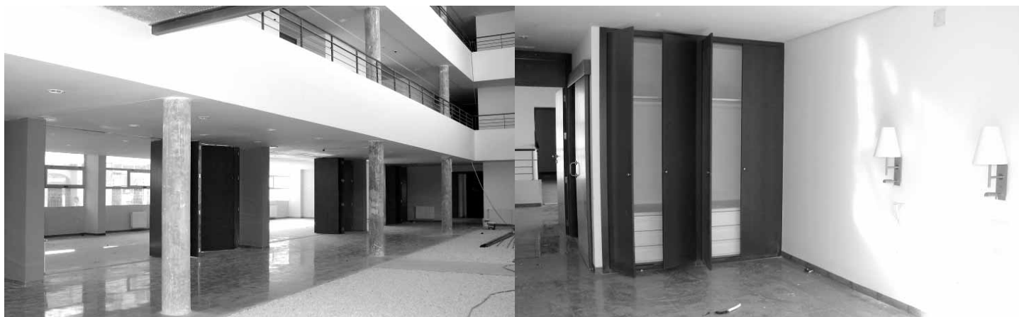
DIFERENTES PERSPECTIVAS ACTUALES DEL EDIFICIO, EN SU EXTERIOR E INTERIOR