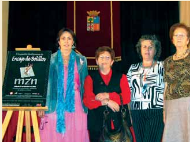
INSTANTE EN EL QUE LAS REPRESENTANTES DE “BOIXET” RECOGIAN SU PREMIO EN MONZÓN