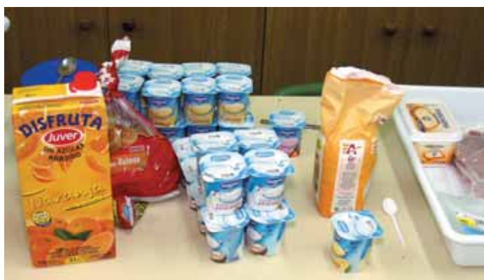
ALGUNOS DE LOS PRODUCTOS QUE DEGUSTARON LOS PARTICIPANTES EN EL “DESAYUNO SALUDABLE”

Los alumnos de los colegios públicos San Antón y Santa Catalina disfrutaron con esta iniciativa que pretende cada año concienciar a niños y padres lo importante que es una alimentación sana para obtener un mejor rendimiento escolar, incidiendo en que hay que comenzar el día con un desayuno consistente.