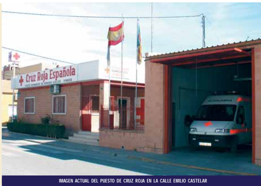
IMAGEN ACTUAL DEL PUESTO DE CRUZ ROJA EN LA CALLE EMILIO CASTELAR

La asamblea local de Cruz Roja Española cuenta con una amplia trayectoria en la localidad, intentando que, Pinoso, tan alejado del Hospital General de Elda, cuente con un servicio de primeros auxilios y posteriormente con la tan demandada ambulancia, que tantos esfuerzos físicos y económicos costó al Ayuntamiento de Pinoso y al propio vecindario.