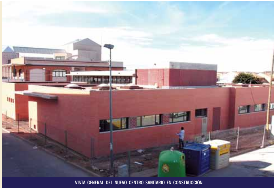
VISTA GENERAL DEL NUEVO CENTRO SANITARIO EN CONSTRUCCIÓN