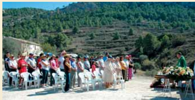
LAS CELEBRACIONES SE LLEVARON A CABO EN LA ERA DE LA PEDANÍA

La pedanía de Tres Fuentes celebró, los días 7 y 8 de octubre, fiestas en honor a la Virgen del Rosario. Los actos se iniciaron con la primera de las romerías previstas, ya que la pequeña imagen de la Virgen del Rosario fue trasladada en andas desde la cueva donde permanece todo el año hasta la antigua era, ubicada en el centro del caserío, y lugar en el que se desarrollaron la totalidad de los actos previstos, tanto deportivos como gastronómicos.