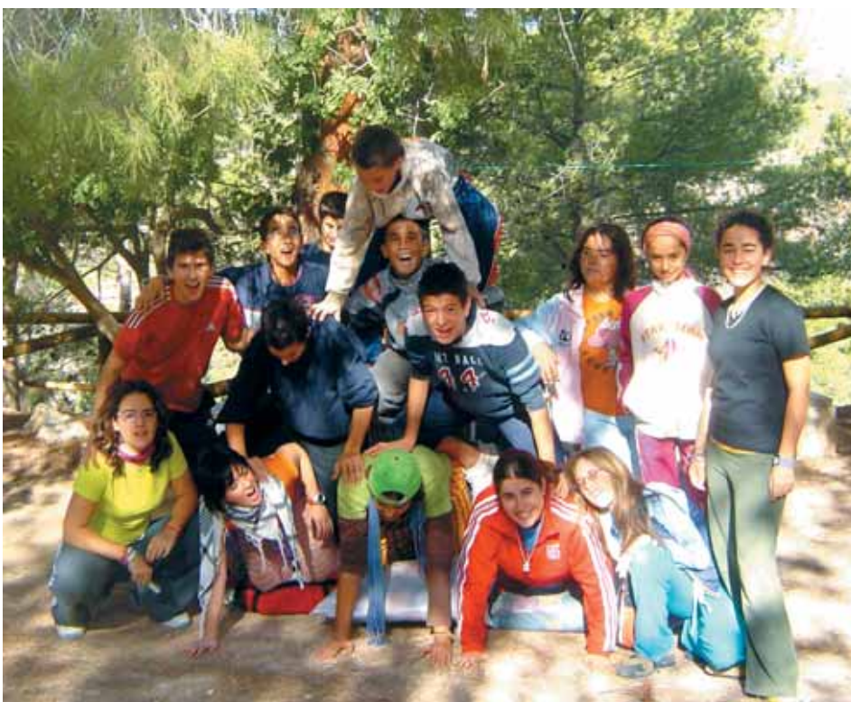
TOTS EL PARTICIPANTS DE LA ACAMPADA I LES MONITORES DE TOT JOVE